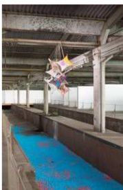
Anna Lena Grau: Pink Spill , 2014, Installation, Foto: Jens Lehmkühler Sonderausstellung Notausgang am Horizont