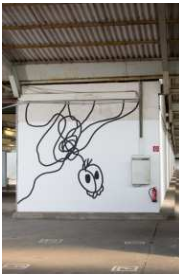
Frank Roeseler: Flaschengeist , 2014, Tusche auf Wand, © VG Bild-Kunst, Bonn 2014 Sonderausstellung Notausgang am Horizont