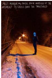
Herwig Gillerke: aus der Serie 10 Seconds , Fotografie, 2014, © VG Bild-Kunst, Bonn 2014 Sonderausstellung Notausgang am Horizont