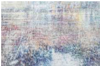
Sibylle Springer: Dim , Acryl und Aquarell auf Leinwand, 2012, © VG Bild-Kunst, Bonn 2014 Sonderausstellung Notausgang am Horizont