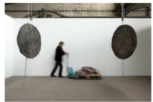
Aufbau der Arbeit Cometivas von Hermine Anthoine auf dem 8. Bremer Kunstfrühling, ausgestellt von der Weserburg | Museum für moderne Kunst, Bremen.