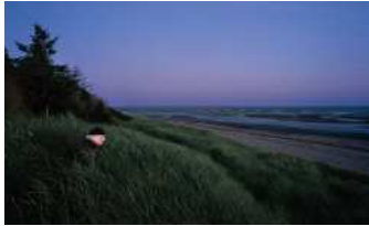
Anja Jensen, Mann am Meer , C-Print, 2010 Sonderausstellung Notausgang am Horizont