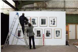
Hängung von Alexander Rischers Fotoarbeiten in der Sonderausstellung Notausgang am Horizont .