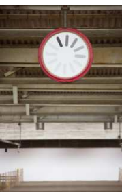
Daniel Wrede: Warten , Kinetisches Objekt, 2014, © VG Bild-Kunst, Bonn 2014, Foto: Jens Lehmkühler Sonderausstellung Notausgang am Horizont