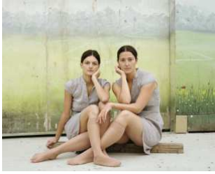
Katharina Lepik: Verschwisterung 5 , C-Print, 2010/11, Courtesy Galerie Hengevoss-Dürkop, Hamburg Ausgestellt von der Galerie Hengevoss-Dürkop, Hamburg