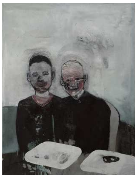
Friedrich Einhoff: Zwei vertraute Figuren II , Mischtechnik, 2008, © Copyright: Friedrich Einhoff, LEVY Galerie, Hamburg Ausgestellt von der LEVY Galerie, Hamburg