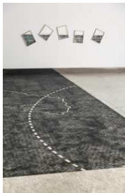
Naho Kawabe: Restrict , 2014, Kohlestaub, Foto: Jens Lehmkühler Sonderausstellung Notausgang am Horizont