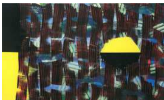
Tim Allen: Ya Bas 2004, Öl auf Leinwand, im Besitz des Künstlers, © Tim Allen Ausgestellt von der Kunsthalle Wilhelmshaven