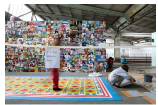
Aufbau von Velada Remix: Santa Lucía auf dem 8. Bremer Kunstfrühling.